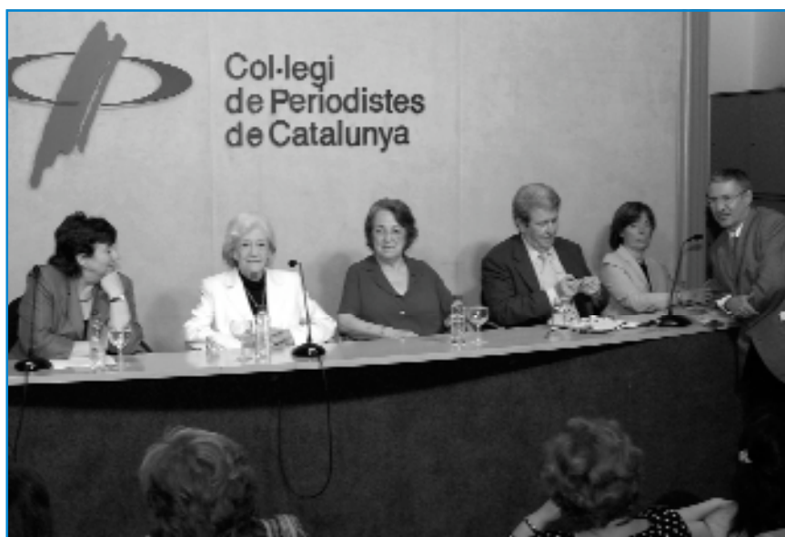
La mesa de homenaje, en el momento de iniciarse el acto