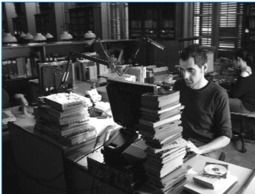
El conflicto del precio del libro enrarece la industria editorial

El conflicto que sacude a la industria del libro con el precio fijo como telón de fondo tiene su raíz en la existencia de dos leyes en aparente contradicción. La ley española del libro, modificada por Real Decreto 484/1990, establece que el libro se ha de vender al precio que fija el editor. La ley contempla que puedan haber descuentos, como máximo, de un 5%, quedando excluidos los libros de bibliófilo, los artísticos, los antiguos, las ediciones agotadas, los libros viejos y los descatalogados.