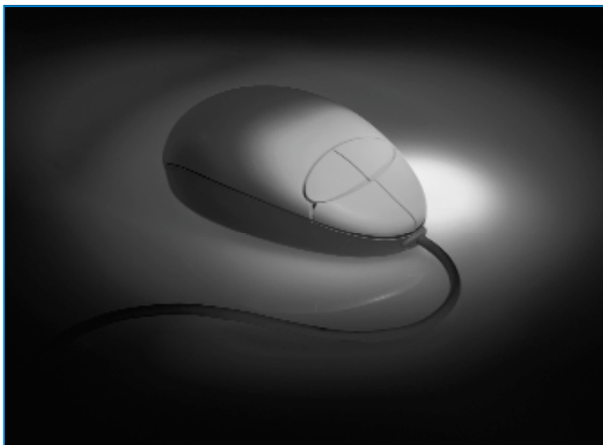
El nuevo entorno digital amplía el acceso a la información