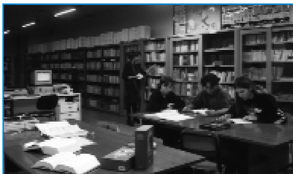
España incumple la normativa de préstamo bibliotecario

Por nuestra parte, las asociaciones profesionales de escritores queremos señalar: