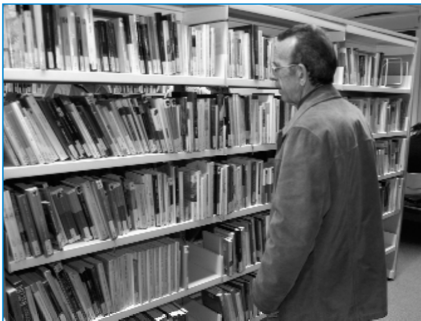
La falta de control de precios repercutiría negativamente en el sector