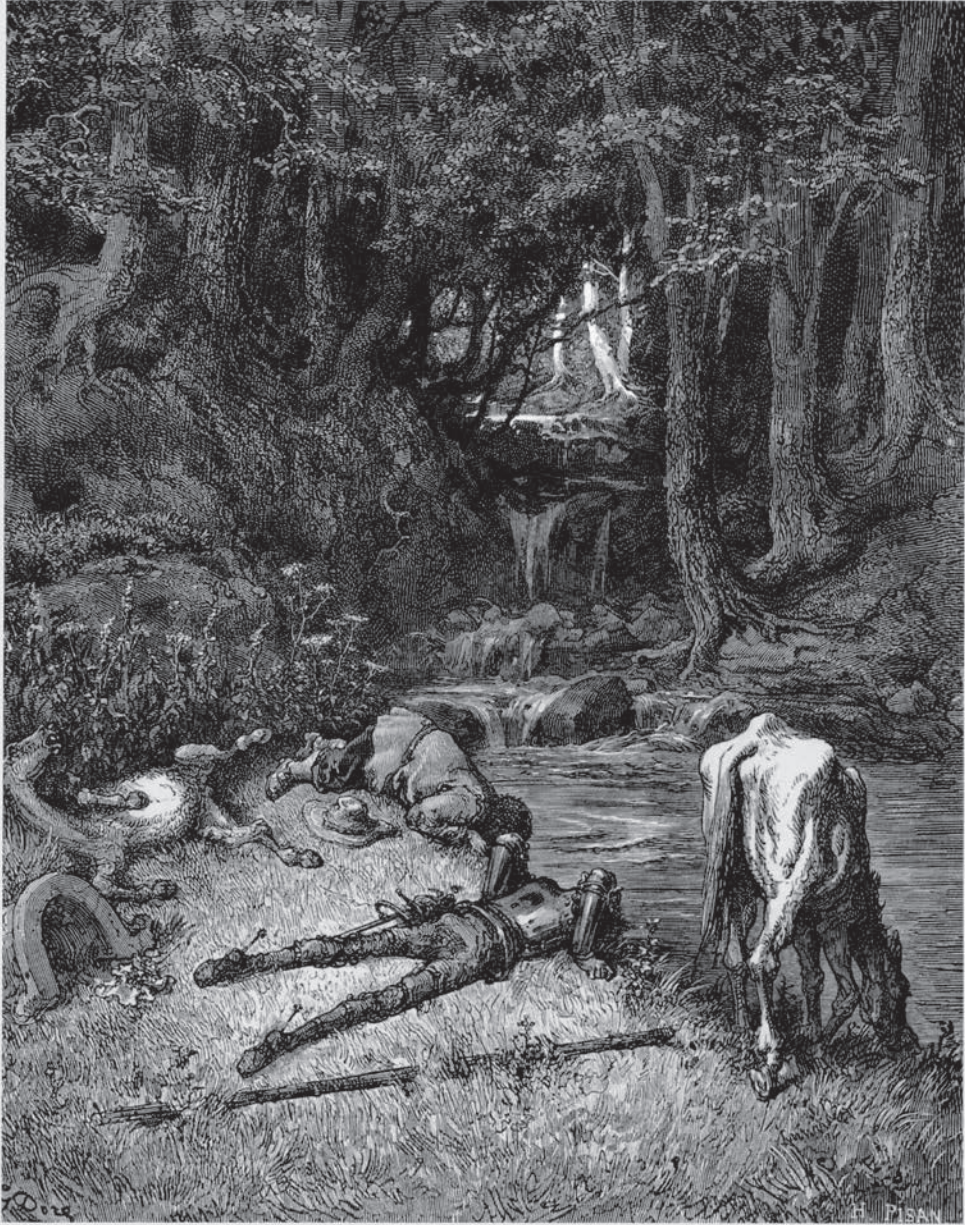
Vinieron á parar a un prado de fresca yerba, 1875-76, GUSTAVE DORÉ.