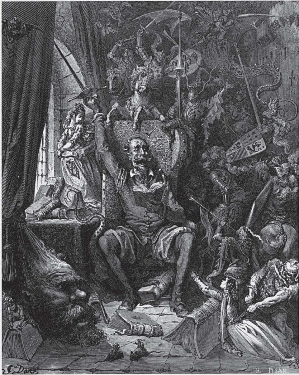
La fantasia se li va omplir de tot allò que llegia als llibres, 1863, GUSTAVE DORÉ.