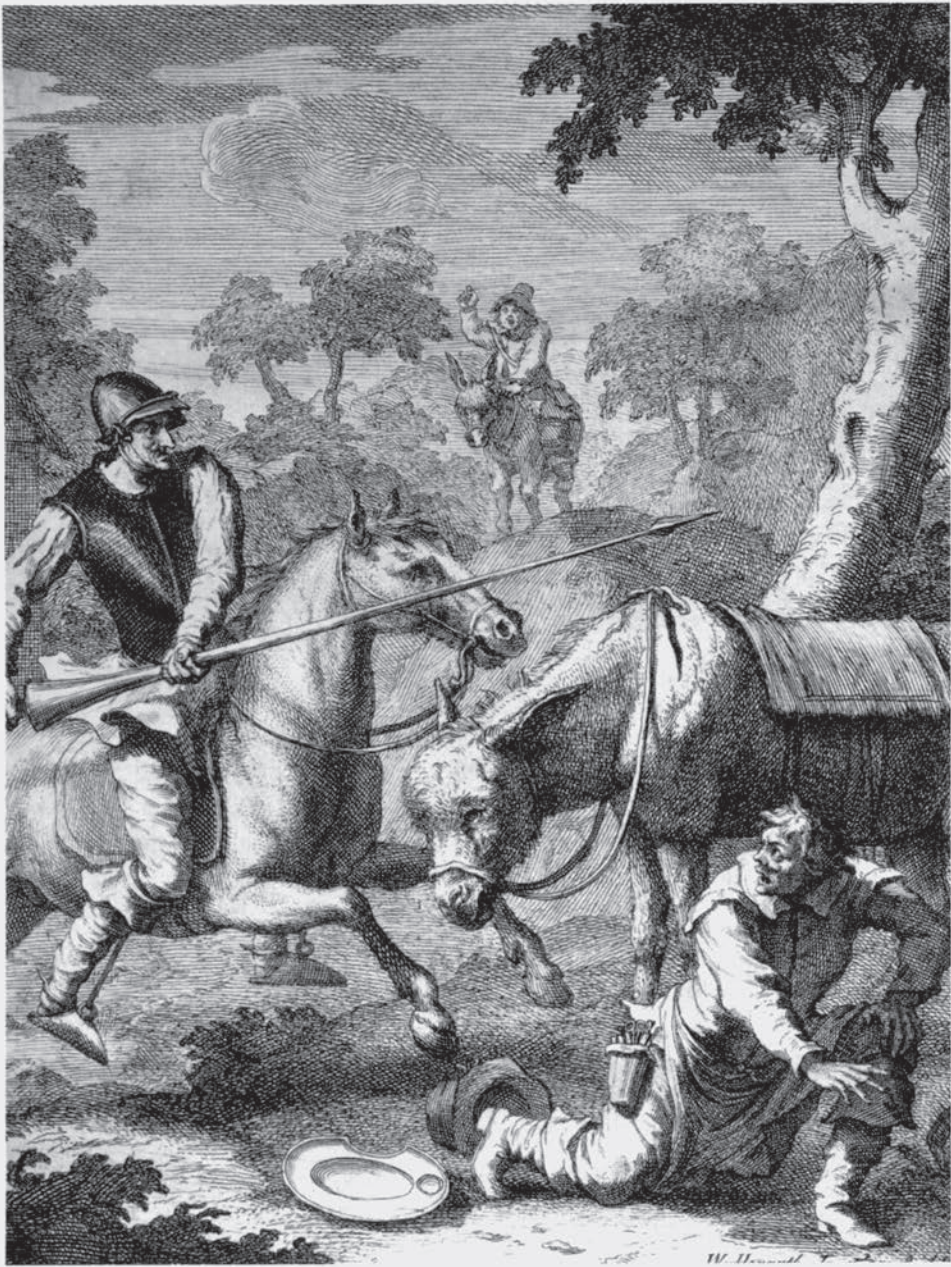
Don Quijote tras vencer al barbero gana el yelmo de Mambrino, 1738, WILLIAM HOGARTH.