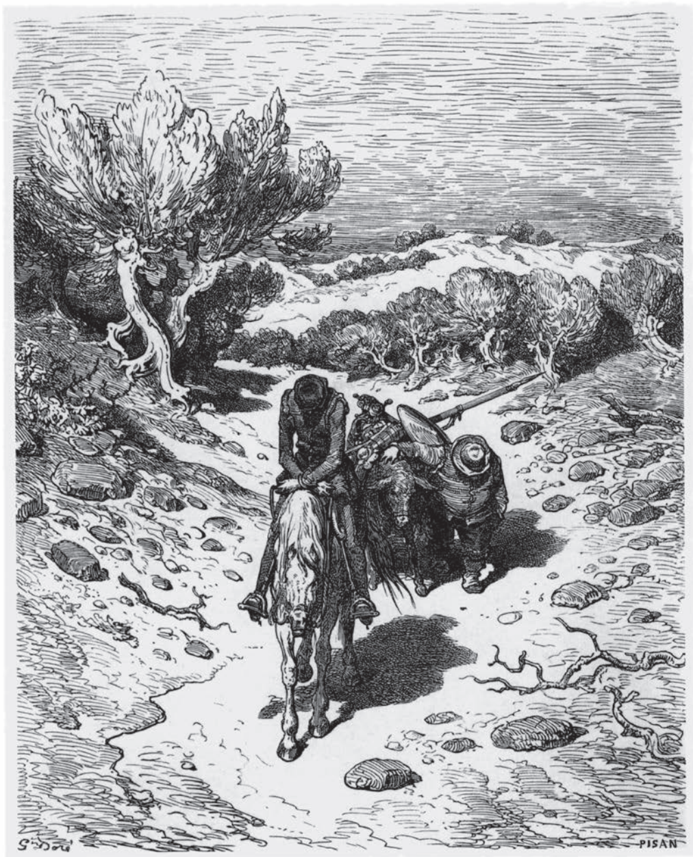
Hice lo que pude, derribáronme , 1875-76, GUSTAVE DORÉ.