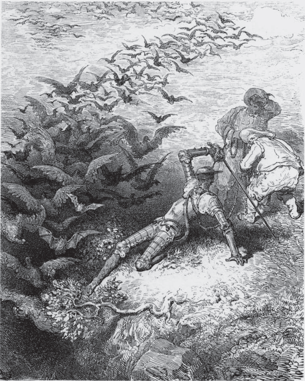
Si él fuera tan agorero como católico cristiano, lo tuviera á mala señal, 1875-76, GUSTAVE DORÉ.