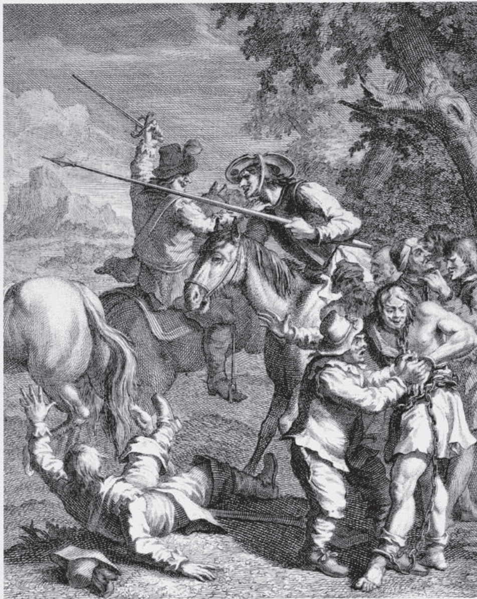
Don Quijote libera a los galeotes , 1738, WILLIAM HOGARTH.