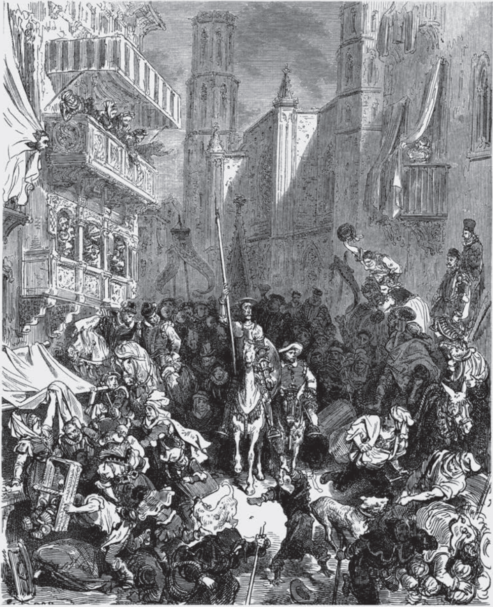
Entrada de Don Quijote en Barcelona, 1875-76, GUSTAVE DORÉ.