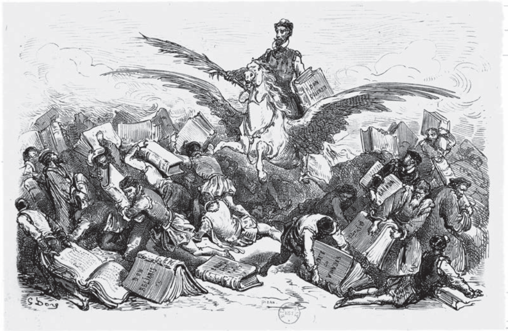
Alonso Quijano: llibres i somnis , 1863, GUSTAVE DORÉ.