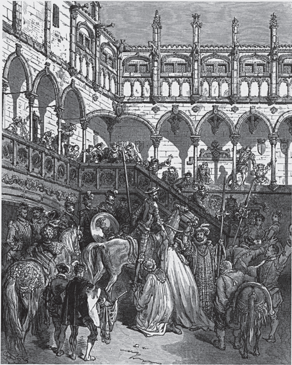
La llegada de Don Quijote y Sancho al palacio de los duques, 1863, GUSTAVE DORÉ.