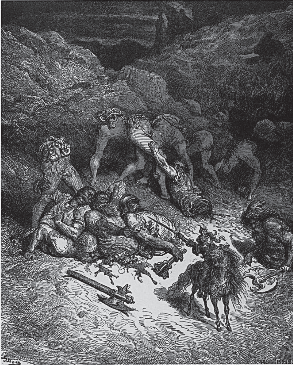
Había vuestra merced de leer lo que leí yo de Félixmarto de Hircania, 1876-78, GUSTAVE DORÉ.