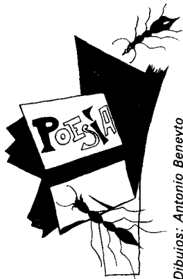
Dibujos: Antonio Beneyto

Por ende, formulamos una llamada a la Comisión Europea para que elabore una Directiva en materia de administración y cobro de la liquidación de los derechos que corresponden al autor, en concepto de la publicación de su obra por medios electrónicos , en la cual se estipule que, en el grado en que los señalados derechos no sean objeto de licencia en el contrato firmado por el autor, la administración de los mismos correrá única y exclusivamente a cargo de las Sociedades de Cobro de los Derechos de Autor, como las que ya existen en la mayor parte de los países europeos con el fin de administrar otras categorías de derechos de autor.