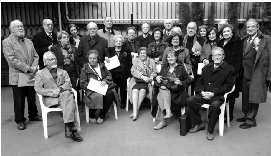
> FOTO DEL GRUP DELS HOMENATJATS, ACOMPANYATS PER LA PRESIDENTA