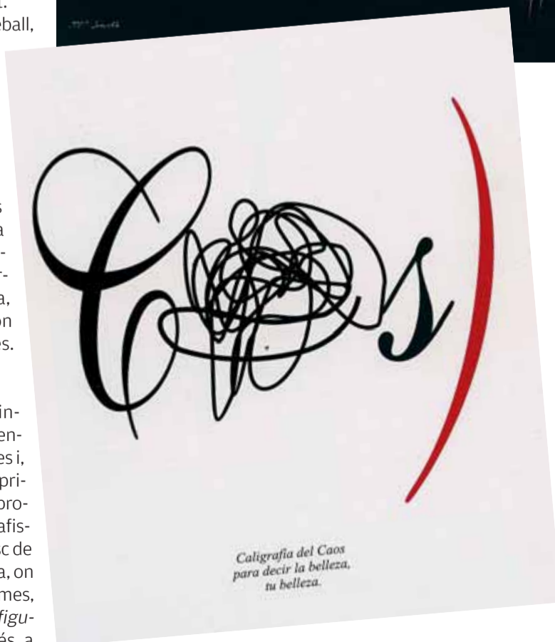
Dalt a l'esquerra, el cal·ligrama Imposible (2007), sota, l'ideogràfic Caligrafía del caos (2005). Damunt d'aquestes ratlles, els grafolàstics El tiempo dentro del tiempo (1984) i Los Claros del Bosque. Homenaje a María Zambrano (1980)