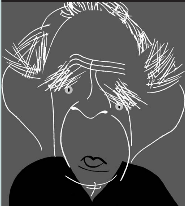
> NORMAN MAILER

Extensió: la que correspon a un volum de 64 pàgines