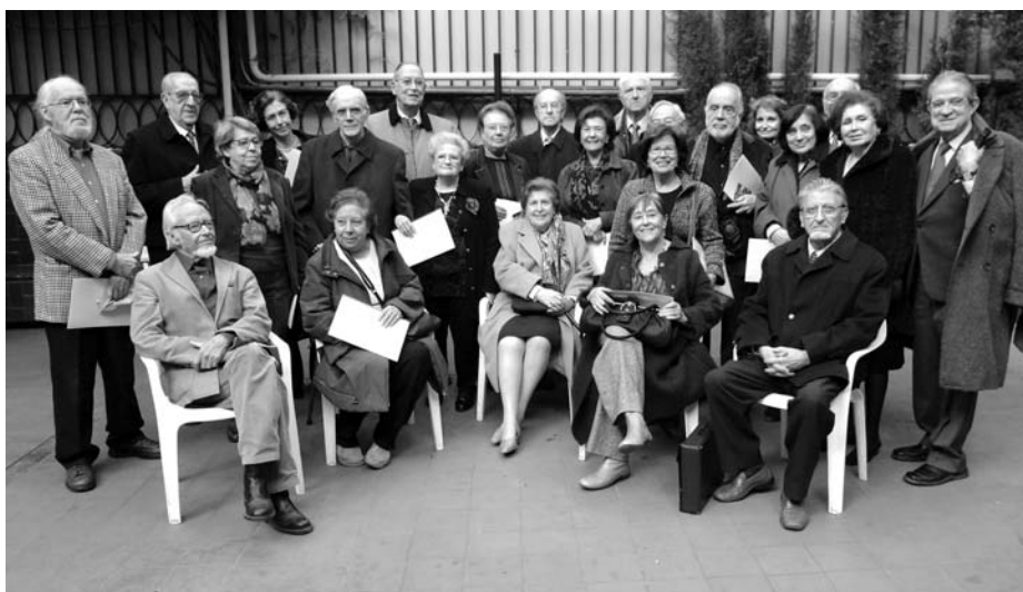
> FOTO DEL GRUPO DE LOS HOMENAJEADOS, ACOMPAÑADOS POR LA PRESIDENTA

Los autores homenajeados con la distinción son: