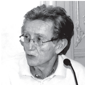
XAVIER RUBERT DE VENTÓS

Filòsof i escriptor, va participar a la fundació del Col·legi de Filosofia. Va ser diputat per al PSOE i membre del Parlament Europeu. És professor d'estètica a la Universitat de Barcelona i catedràtic de la Politècnica.