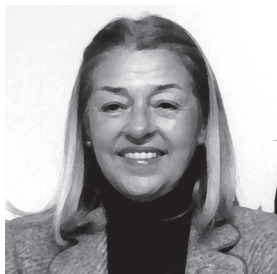
BEATRIZ DE MOURA

Licenciada en Traducción Literaria e Historia en la Escuela de Intérpretes de Ginebra. Fundadora y directora literaria de Tusquets Editores. Miembro activo de DMD.